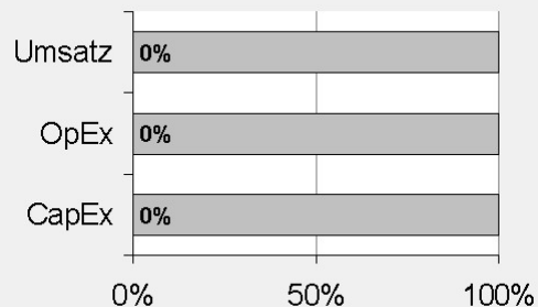
2. Taxonomiekonformität der Investitionen ohne Staatsanleihen*